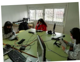
Grabación de radio